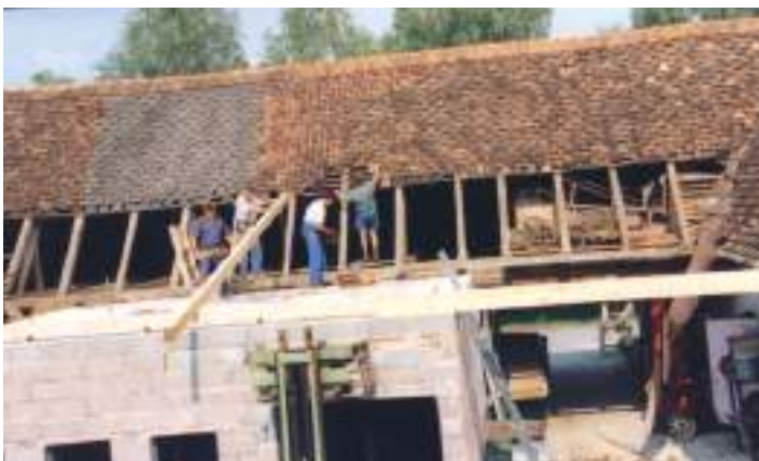
Da geht es ordentlich rund – vor der legendären Sonnenfinsternis 1999