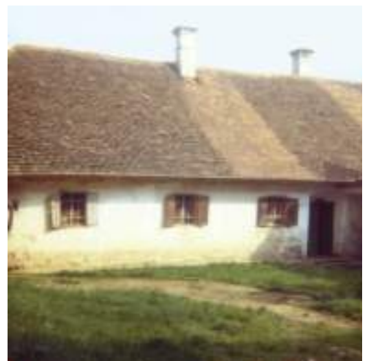
Links mein Vater am Beginn des Umbaues, Hermi und Karli vor dem neuen Hochsilo, rechts unser altes Wohnhaus vom Hof aus gesehen.