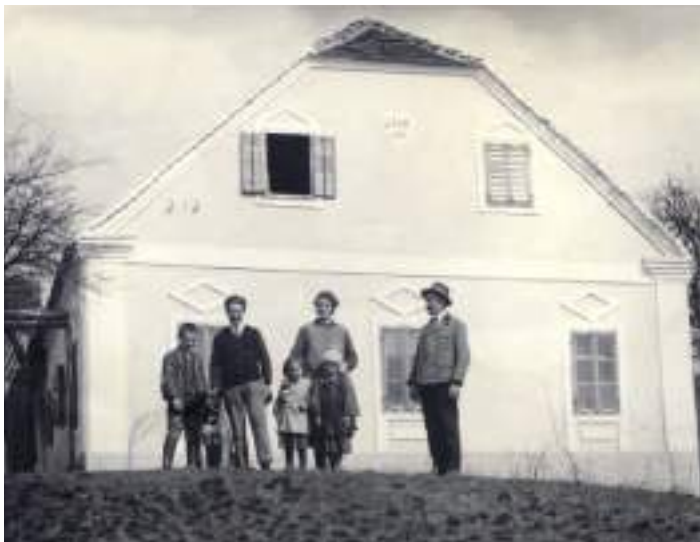
Teile der Familie vor dem neu renovierten Wohnhaus 1933