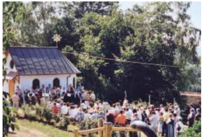
Ein kleiner Anblick von unserem Kapellenfest

Die größte Strafandrohung für unsere Kinder ist, wenn sie nicht