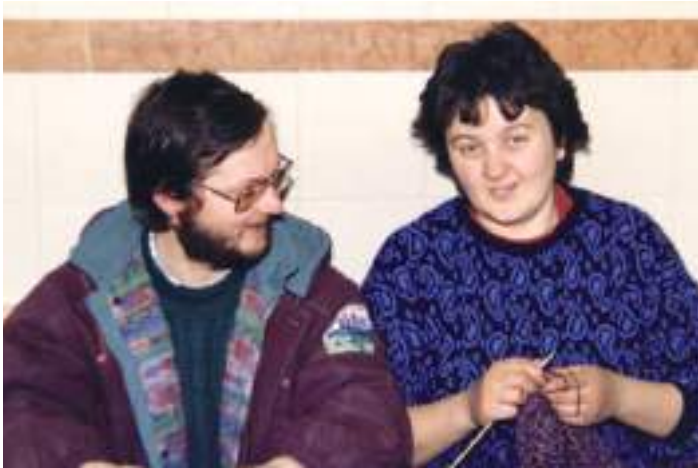
Ich glaube da strickt sich was zusammen Foto von 1993

auch, nachdem der Hausbau soweit gediehen war, der Buschenschank Breitenberger ins Leben gerufen (auch dies sind heuer 30 Jahre), obwohl es auch in den 60er Jahren einen sporadischen Buschenschank gegeben hat. Sehr langsam kam dann der Weinbau in meine Hände – und damit auch eine Weiterentwick-