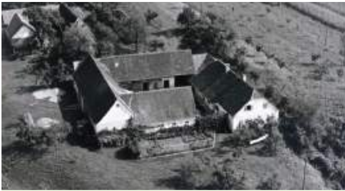
Unser Breitenbergerhof am Beginn der 60er Jahre

und ich haben dies in all den Jahren sehr leidvoll erfahren. Mit über 50 Jahren ging mein Vater mit meiner Mutter an ein sehr großes Vorhaben, nämlich den Um- und Neubau unseres Wohnhauses. Auch wir zwei Kinder haben intensiv – auch arbeitsmäßig daran teilgenommen. Meine Schwester hat in dieser Zeit ihre Ausbildung zum „Bildungsschuster“ (Lehrer) absolviert und ich beendete 1978 die Fachschule Silberberg. In dieser Zeit wurde