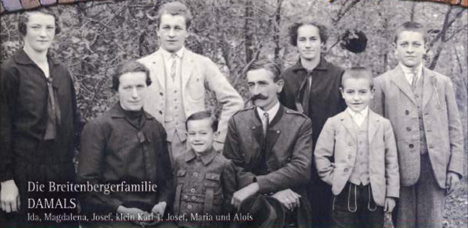
Die Breitenbergerfamilie DAMALS