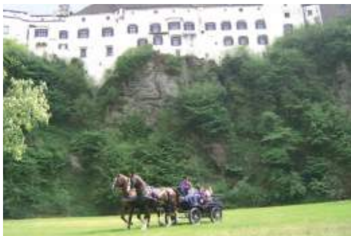
Die Breitenbergers auf großer Fahrt mit dem Schlosskutscher unter Herberstein – jedem zu empfehlen.